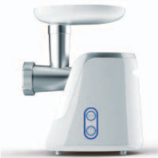
Art.-Nr. 41403 Design Fleischwolf Plus

Verarbeiten Sie frisches Rind, Schwein, Lamm oder Geflügel zu perfekten Burgern und bestimmen Sie selbst die Frische und Qualität. Sie werden den Unterschied schmecken!